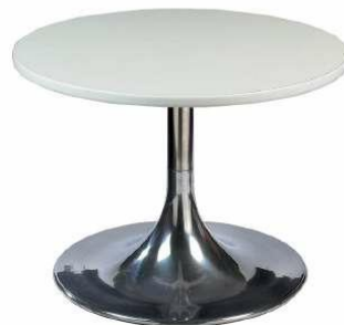
TABLE BASSE COROLLE