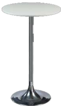
TABLE HAUTE COROLLE